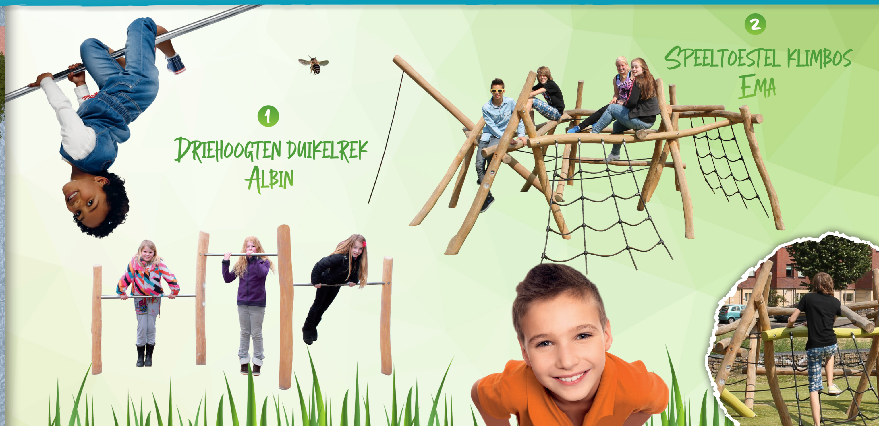
1 DRIEHOOGTEN DUIKELREK ALBIN